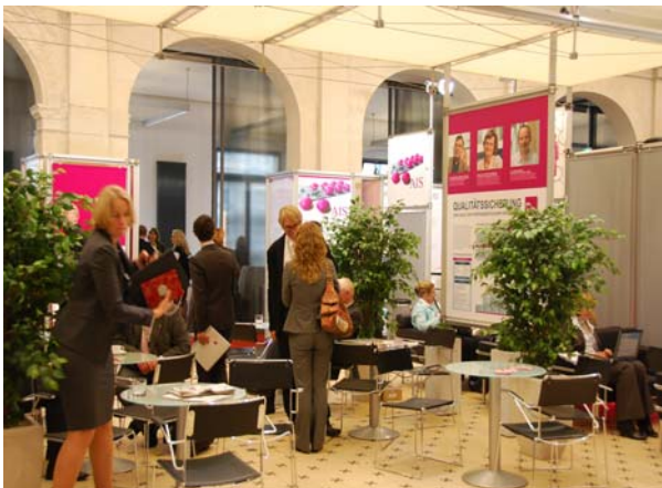
KV-Lounge – Treffpunkt der Messebesucher

Zu den Ausstellern gehörten zum Beispiel das Gesundheitsnetz Qualität und Effizienz Nürnberg, das Leipziger MVZ-Kopfzentrum sowie die Netze Gesunder Odenwald und Gesundes Kinzigtal. Eine Industriemesse mit Ausstellern aus der (IT-)Informations- und Beratungsbranche ergänzte das Informationsangebot.